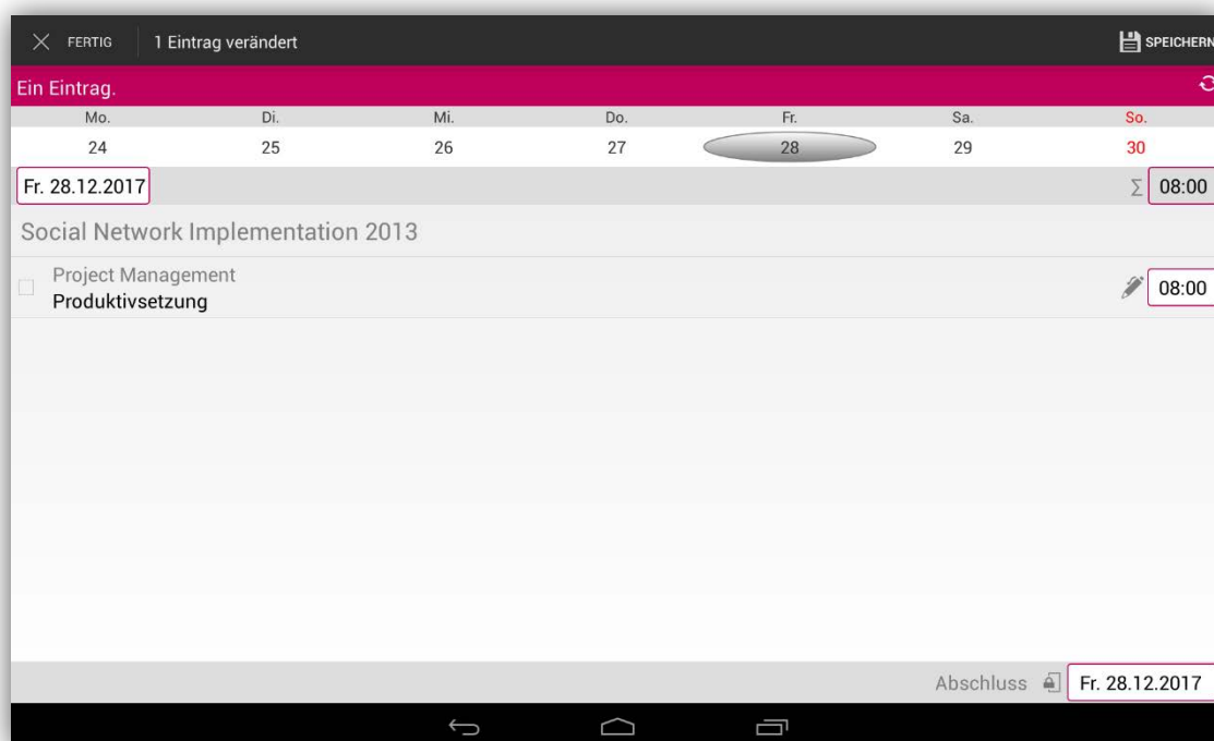
Übersicht der Kontierungen für den Projektmanager

Hier befinden sich die Projekte, auf die aktuell Stunden kontiert werden können. Der angezeigte Zeitraum kann eingestellt werden. Ein Klick auf ein Arbeitspaket öffnet einen Dialog zur Auswahl oder Eingabe der geleisteten Arbeitszeit. Zusätzlich kann noch eine Beschreibung zur Tätigkeit eingegeben werden. Nach der Eingabe der geleisteten Arbeitszeit erscheint neben dem Datensatz das Symbol eines Stifts als Hinweis, dass hier noch nicht gespeicherte Änderungen vorliegen.